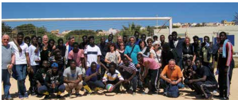
Giovani migranti a Lampedusa con Il gruppo di Brugherio

Stando sul posto, vedendo con gli occhi e toccando con mano questa realtà si rimane senza parole, perché si comprende bene la grandezza del problema che spesso non ha soluzioni immediate...se non quelle di mettere in atto atteggiamenti evangelici come fa la gente qui a Lampedusa...si fa molto presto a tagliare i discorsi, a dire che: "ma stiano a casa loro, cosa vengono a fare"...ma quando si ascolta con le proprie orecchie le violenze che subiscono, quando come dicono i soccorritori vedi corpi martoriati, persone con la pelle